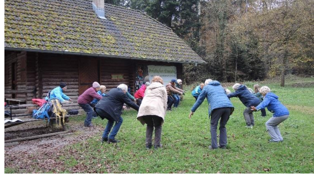
Links oben: Sonnenuntergangswanderung 30.05.2024, rechts oben: Vereinsausflug nach Saverne 19.06.24 Links unten: Eulenwanderung 20.10.2024, rechts unten: Gesundheitswanderung 13.11.2024

2024 Zum 140jährigen Jubiläum stiftet die Ortsgruppe Baden-Baden im Juli eine schöne Sitzgruppe oberhalb der Eckhöfe in der Nähe des Arboretums. Von hier bietet sich ein wundervoller Blick auf die Schwarzwaldhöhen bis hin zur Badener Höhe und der Hornisgrinde.