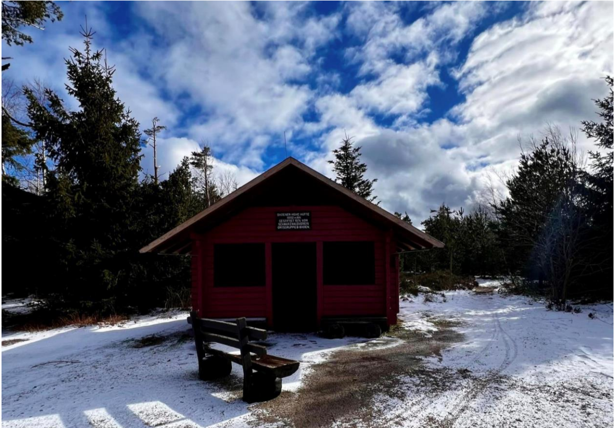
Die frisch renovierte Schutzhütte auf der Badener Höhe im Februar 2024

Wöchentlich werden ein bis drei Wanderungen für unterschiedliche Zielgruppen angeboten – von der gemütlichen Seniorenwanderung über Themen- und Genusswanderungen bis zum knackigen 30-Kilometer-Track. Auf weit über 100 Wanderungen kommt die Ortsgruppe so pro Jahr. Die Mitgliederzahlen steigen seit einigen Jahren wieder.