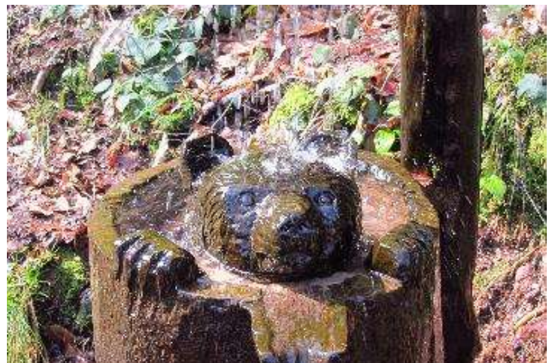
Der niedliche Duschbär..